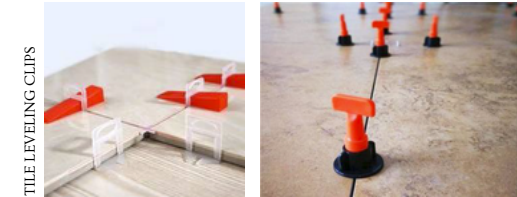
TILE LEVELING CLIPS